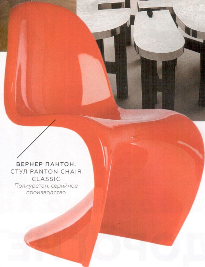
ВЕРНЕР ПАНТОН. СТУЛ PANTON CHAIR CLASSIC Полиуретан, серийное производство

ясь извилистыми барочными силуэтами. А вот мебель американца Венделла Касла и вовсе утратила свои утилитарные функции. Едва ли можно думать о комфорте, сидя на креслах и стульях из отшлифованного бетона и ламинированного слоистого пластика.