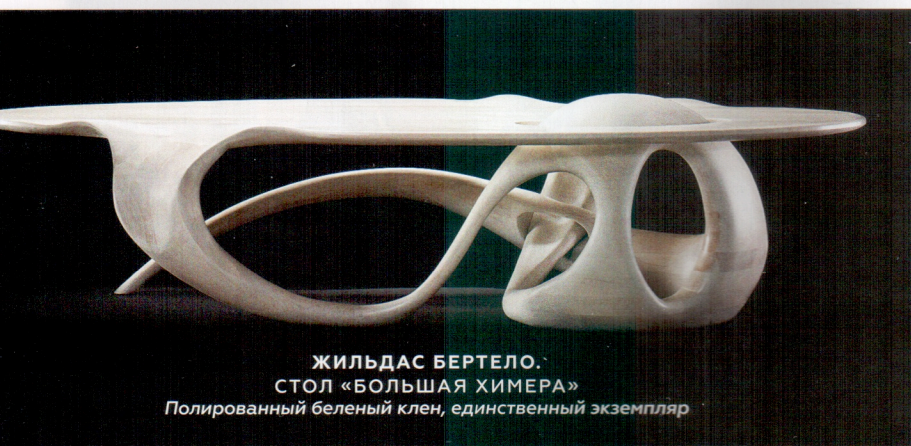
ЖИЛЬДАС БЕРТЕЛО. СТОЛ «БОЛЬШАЯ ХИМЕРА» Полированный беленый клен, единственный экземпляр

РЫНОК ДИЗАЙНА ВО МНОГОМ КОНКУРИРУЕТ С РЫНКОМ СОВРЕМЕННОГО ИСКУССТВА. НАПРИМЕР, НА ШЕЗЛОНГЕ ИЗ АЛЮМИНИЯ СЕГОДНЯ МОЖНО ЗАРАБОТАТЬ £2,5 МЛН.